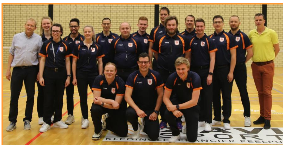
De Masterclass tijdens de finale van de VolleybalDirect open