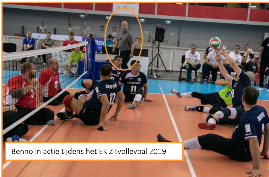
Benno in actie tijdens het EK Zitvolleybal 2019

Ik heb zes dagen lang iedere dag een wedstrijd gefloten en een wedstrijd als reserve scheidsrechter gefungeerd. Ik heb mooie wedstrijden mogen fluiten, waaronder Rusland tegen Bosnië en Herzegovina (dit bleek achteraf ook de finale te zijn) en Duitsland tegen Oekraïne; beide wedstrijden bij de heren. Op de voorlaatste dag kreeg ik de halve finale bij de dames, Italië tegen Duitsland, toegewezen. Een belangrijke wedstrijd, omdat de winnaar van deze wedstrijd zich zou kwalificeren voor de Paralympics.