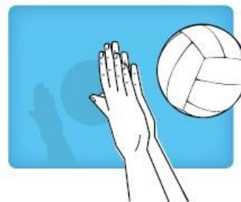
Chopping two handed action twee handige hak beweging