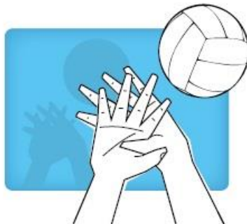
Overlapping hands overlappende handen