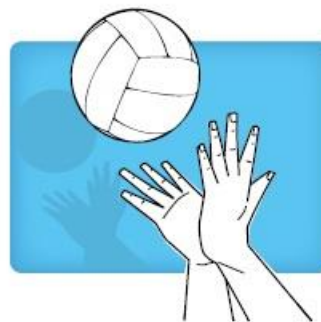
"Gator" hit krokodillen techniek