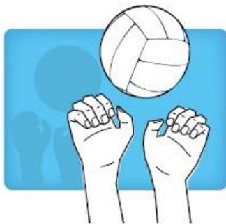
"Tiger" Fingers spelen met de knokkels