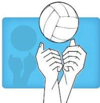
Overhand two handed "punch" twee handige stomp